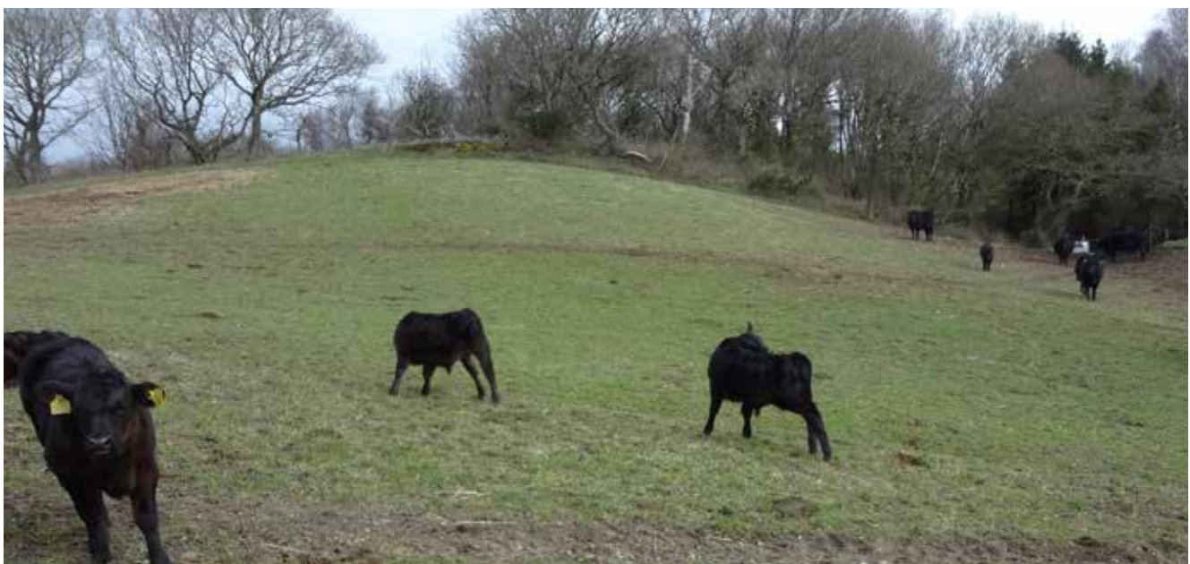
BILLEDE 16: Et meget afvekslende og bakket naturareal med slugter og skov giver god mulighed for ly og læ.

Landmanden ser det som en fordel, hvis dyrene får ødelagt nogle af træerne under vinterperioden, så der naturligt bliver tyndet lidt ud i bestanden af træer.