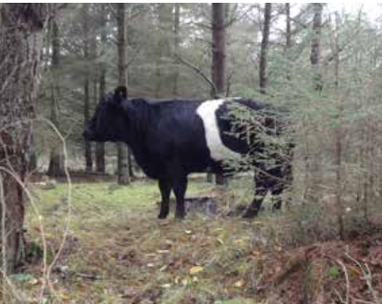
BILLEDE 3: Findes der naturligt ly og læ, er der ikke behov for eller krav om læskur.