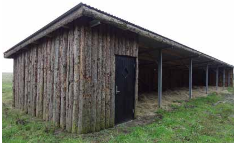
BILLEDE 2: Et åbent læskur giver dyrene mulighed for hurtigt at komme væk.

Læskuret er 28 m x 4 m med fast bagvæg, åbent fortil og med et mindre rum til bl.a. drikkevandsboring. Læskuret koster omkring 200.000 kr., men da de selv har bygget det, har det kostet 120.000 kr.