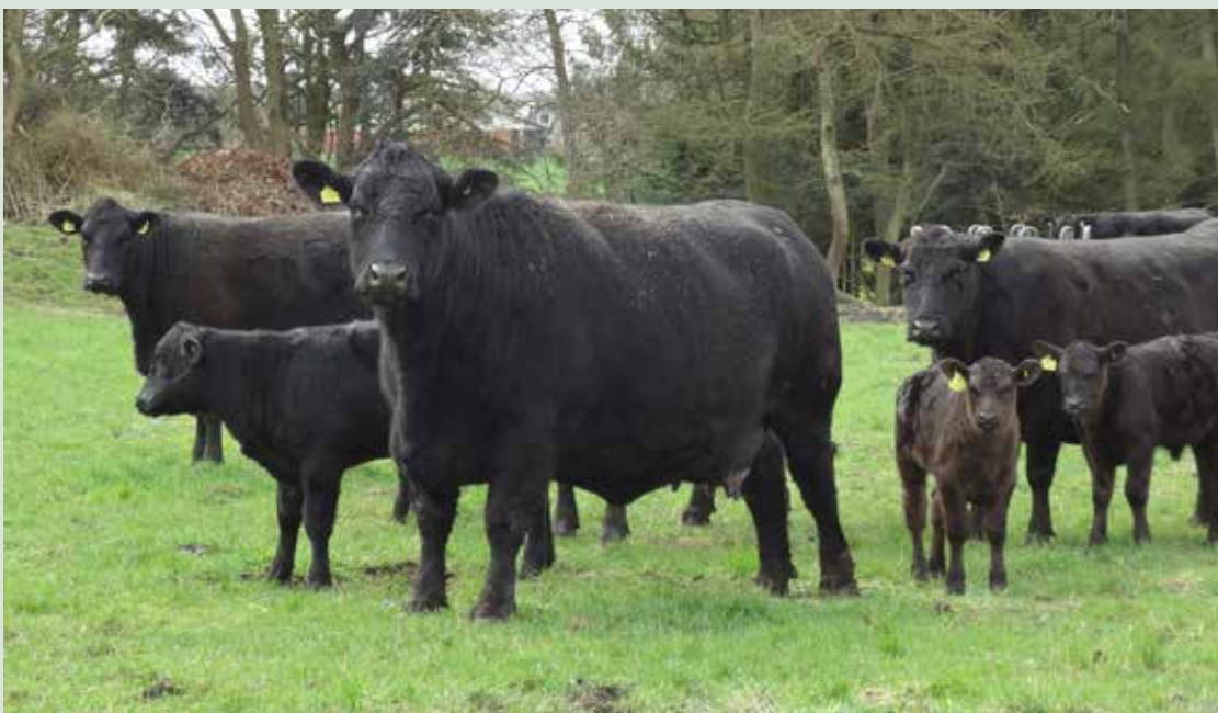
BILLEDE 1: Dyrene skal være i god foderstand til at klare vinterforholdene.