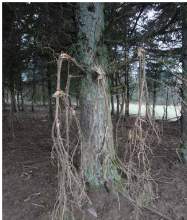
BILLEDE 15: Dyrene er glade for at have træer at klø sig op ad.