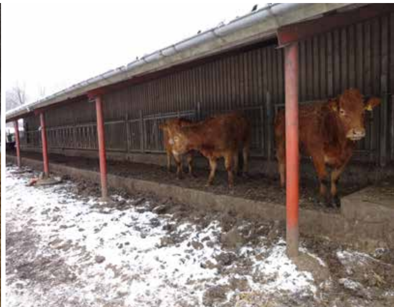
BILLEDE 31: Et halvtag til stalden fungerer som ly og læ til dyrene. Dyrene har her også mulighed for at gå ind i stalden.