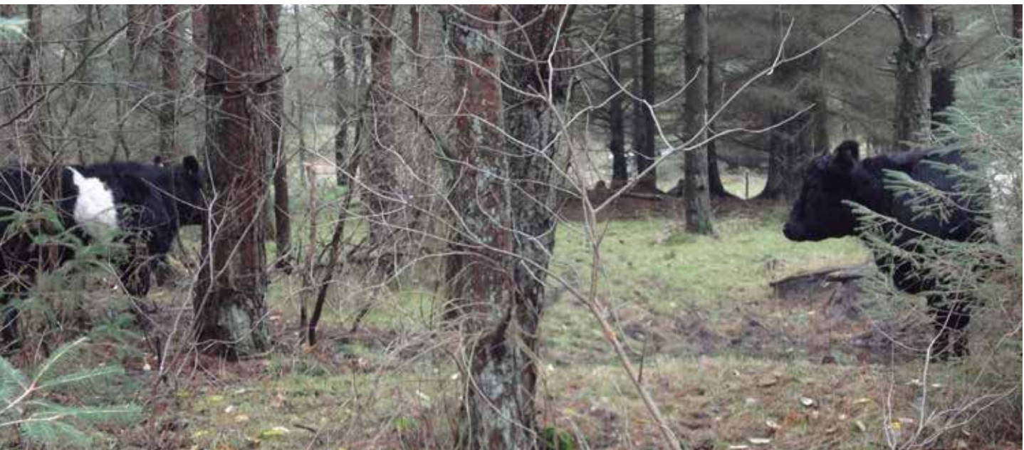
BILLEDE 37: Naturen kan yde beskyttelse mod vintervejret, her er der Galloway kvæg i granskov.

"Vinterperioden", som der her refereres til, er fra den 1. december til den 1. marts samt i perioder med vinterlignende vejr. Der kan ofte opstå vinterlignende forhold i november og marts, men også i oktober og april. Der kan derfor være behov for, at dyrene har adgang til stald eller læskur før den 1. december og ligeledes have adgang til stald eller læskur længere tid end til 1. marts.