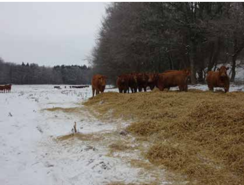
BILLEDE 30: Der strøs med halm i områder med læ som er højt beliggende på arealet

Der bliver strøet med halm hver 2.-3. dag. Dyrene er glade for at ligge i og æde af halmen. Der strøs på det højeste beliggende sted på arealet, så der ikke så nemt bliver mudret. Det strøede areal ligger, så skoven yder læ fra øst. Der fodres med græsensilage, hø og halm i foderhækkene. Foderhækkene bliver flyttet rundt på arealet efter behov, så der ikke bliver for mudret rundt om dem. Dyrenes huld vurderes løbende, da det er vigtigt for deres velfærd, specielt når de er ude i vinterperioden.