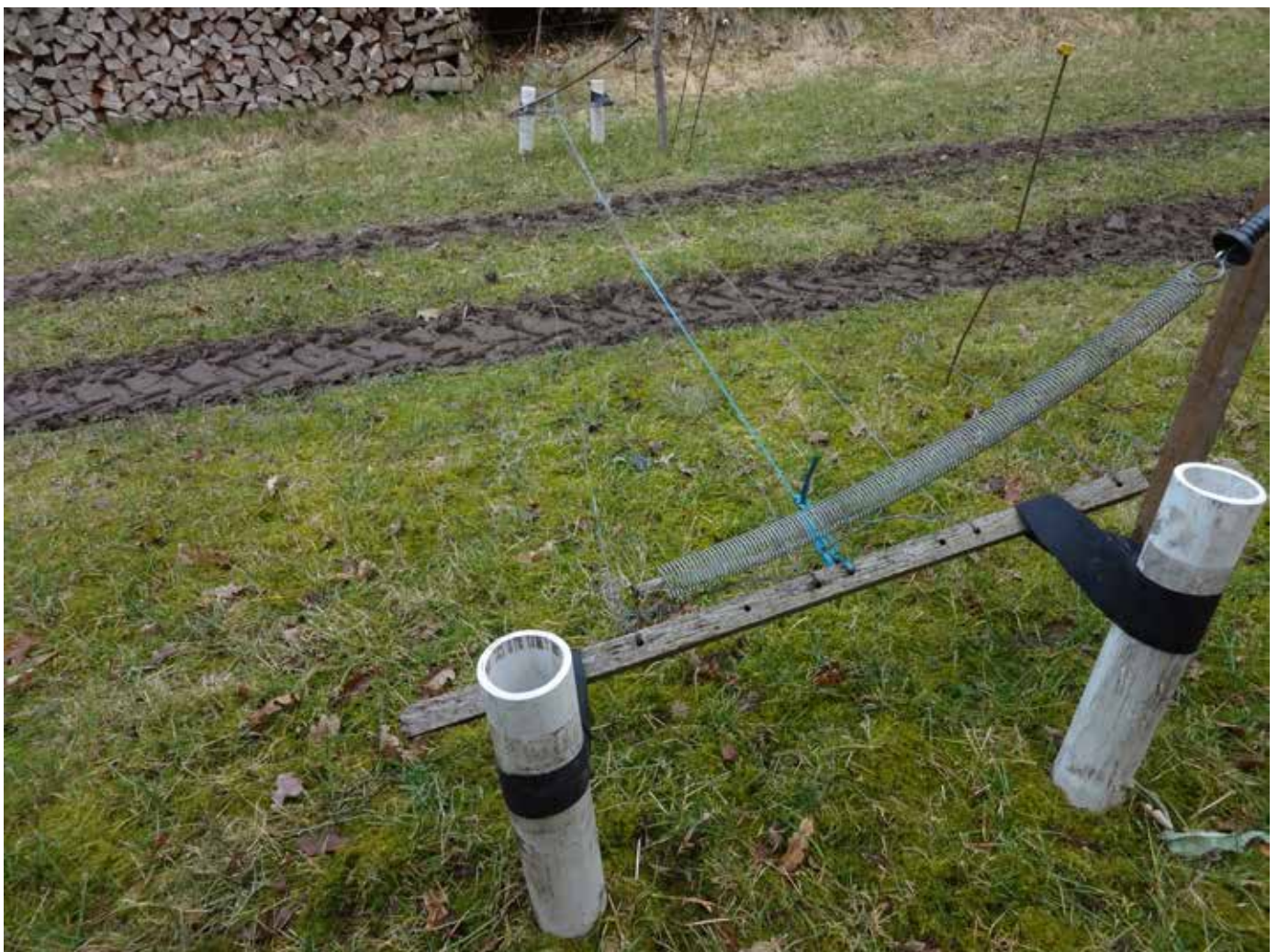
BILLEDE 20: Landmanden skal ikke ud af traktoren for at åbne og lukke hegnsled med dette system. De fire hegnstråde på langs gør, at dyrene ikke løber ud.

Om vinteren skal der tit køres ud på arealerne med traktor for at fodre, flytte foderhæke, strø mv, så derfor har landmanden lavet et system, som gør, at han kan køre med traktoren over eltråden uden at skulle åbne og lukke hegnsled. Se systemet på billede 20. Systemet består af 4 vandrette hegnstråde nr. 14. Disse er bundet på 2 stk. hårdtræs-mellempæle og er indbyrdes forbundet. 2 stk. fjederled forbinder hegnstrådene med strømforsyningen. De fire parallelle hegnstråde er spændt op mellem 4 pæle med 2 stk. slangeafklip ca. 6 cm. Pælene kan enten være af træ, eller som her plastikrør fra wrapplastic. Systemet er monteret ca. 40 cm over jorden. Hvis dyrene har svært ved at se trådene, kan der monteres f.eks. blå pressegarnt mellem hegnstrådene.