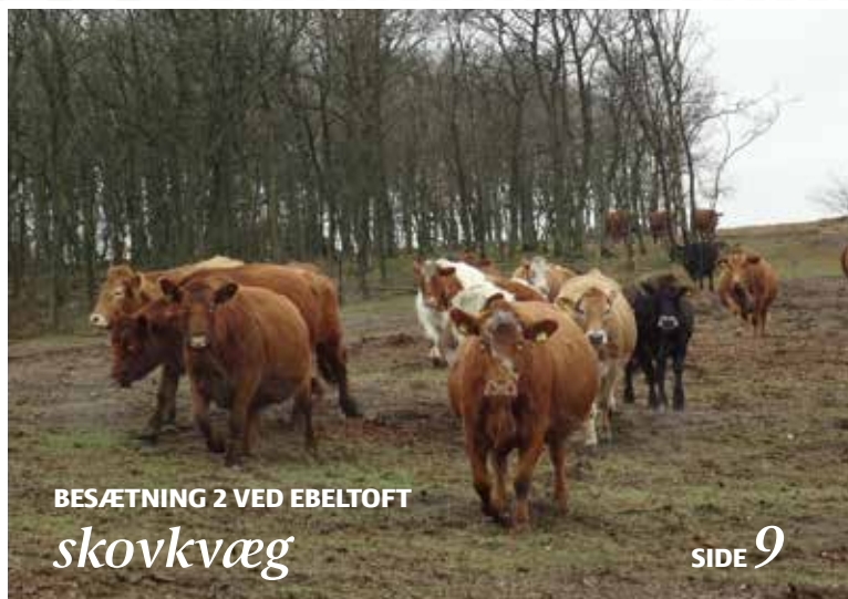
BESÆTNING 2 VED EBELTOFT