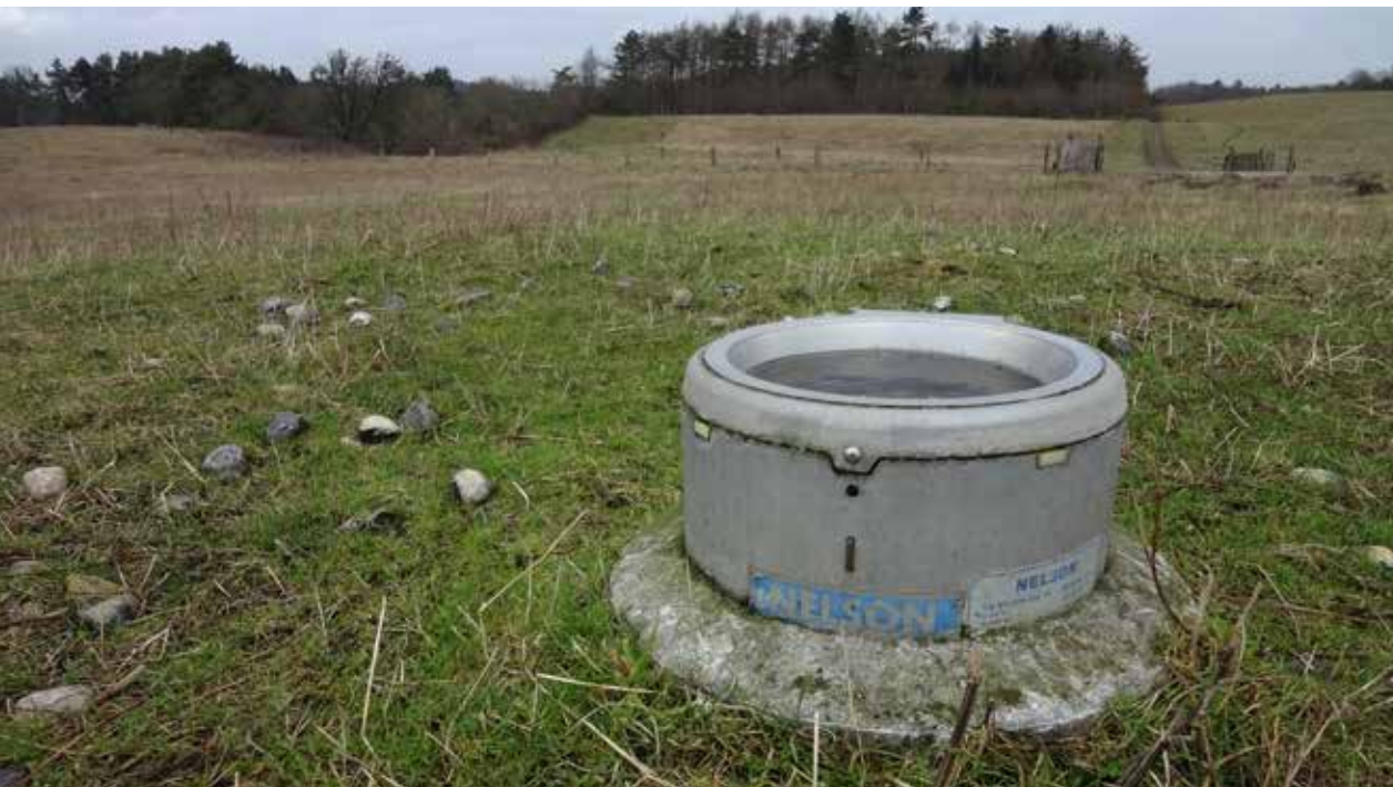
BILLEDE 7: Drikkekop med el.

Dyrene går på et stort areal på samlet 1400 ha, som både er med skov, åbne arealer og bakker. Det er derfor altid muligt for dyrene at komme i ly og læ, hvis der skulle være behov for det.