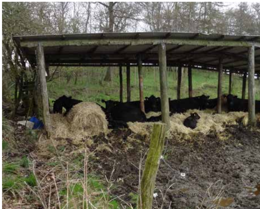
BILLEDE 22: Læskuret er åbent.