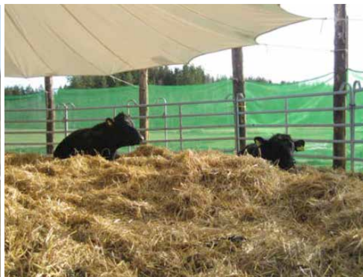
BILLEDE 35 og 36: En flytbar udgave af en telstald, her med kvier af kødrace (fra JTI-rapport 374).