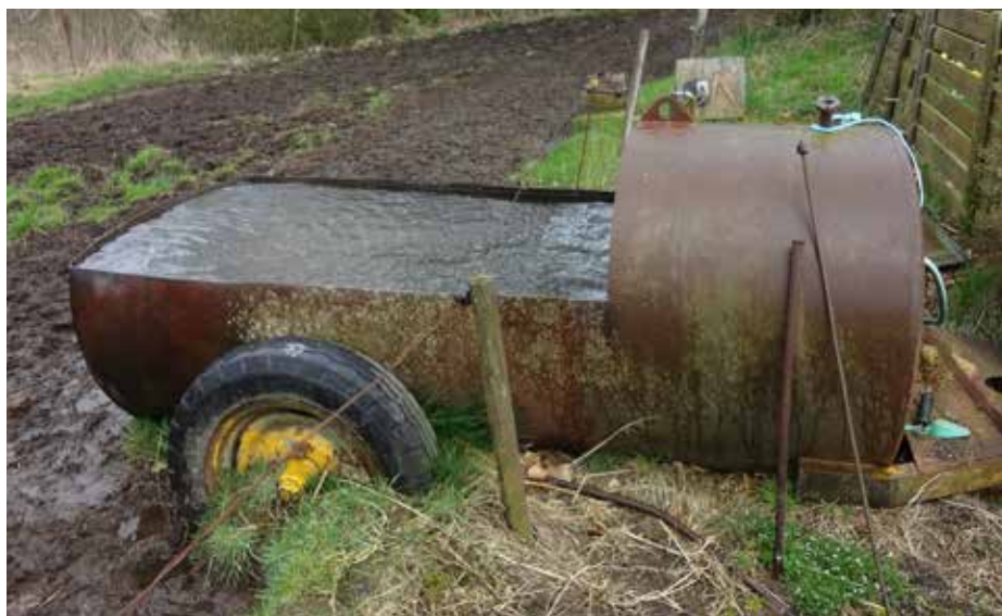
BILLEDE 24: Gamle tanke fungerer som drikkekar, når det ikke er frostvejr.

For at højne dyrevelfærden er der sat dæk op i et stativ, som de kan klø sig op ad eller puffe rundt med, se billede 26. Derudover køres de træer, der er væltet i skoven ud til dyrene, så de har noget at klø sig op ad samt æde barken af. Landmanden mener, at det er godt middel mod orm, at dyrene spiser bark. Dyrene kan også gå ind i en tilstødende granskov (på flere arealer), hvor de finder træer og stubbe at klø sig på, som ses på billede 27 og 28. Landmanden mener ikke, at træerne tager skade af, at dyrene går der.