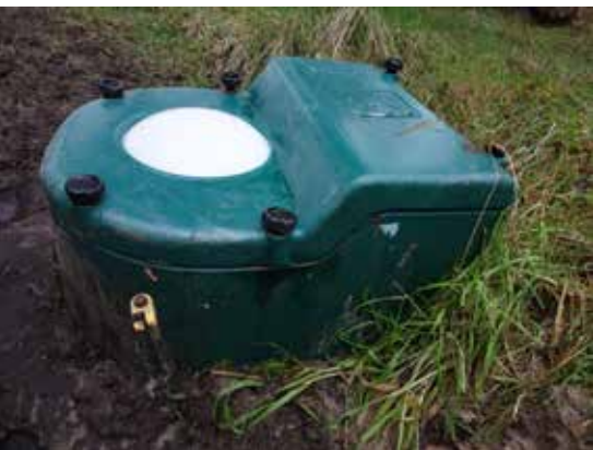
BILLEDE 4: Isoleret drikkekar med flydebold hos dyrene på skovarealet.