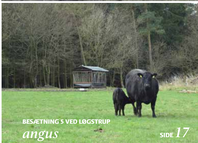
BESÆTNING 5 VED LØGSTRUP