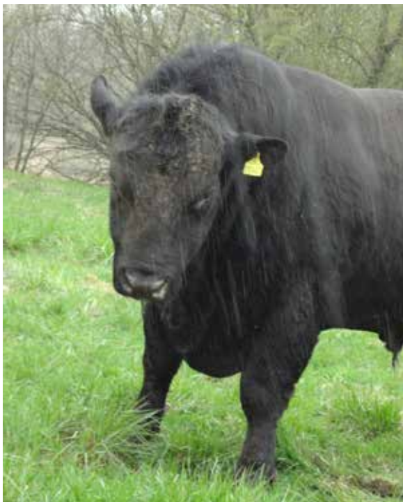
BILLEDE 21: Selvom det regner og er koldt vælger dyrene ofte at blive ude i stedet for at gå ind i de lukkede haller, de har adgang til.