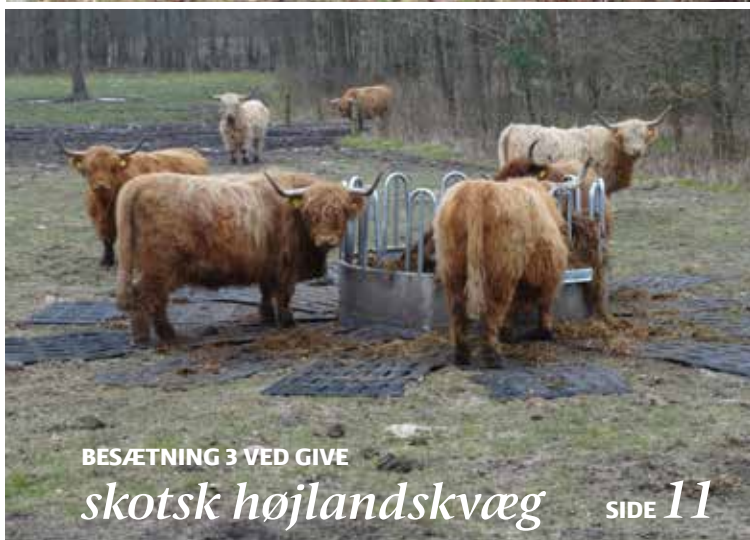
BESÆTNING 3 VED GIVE