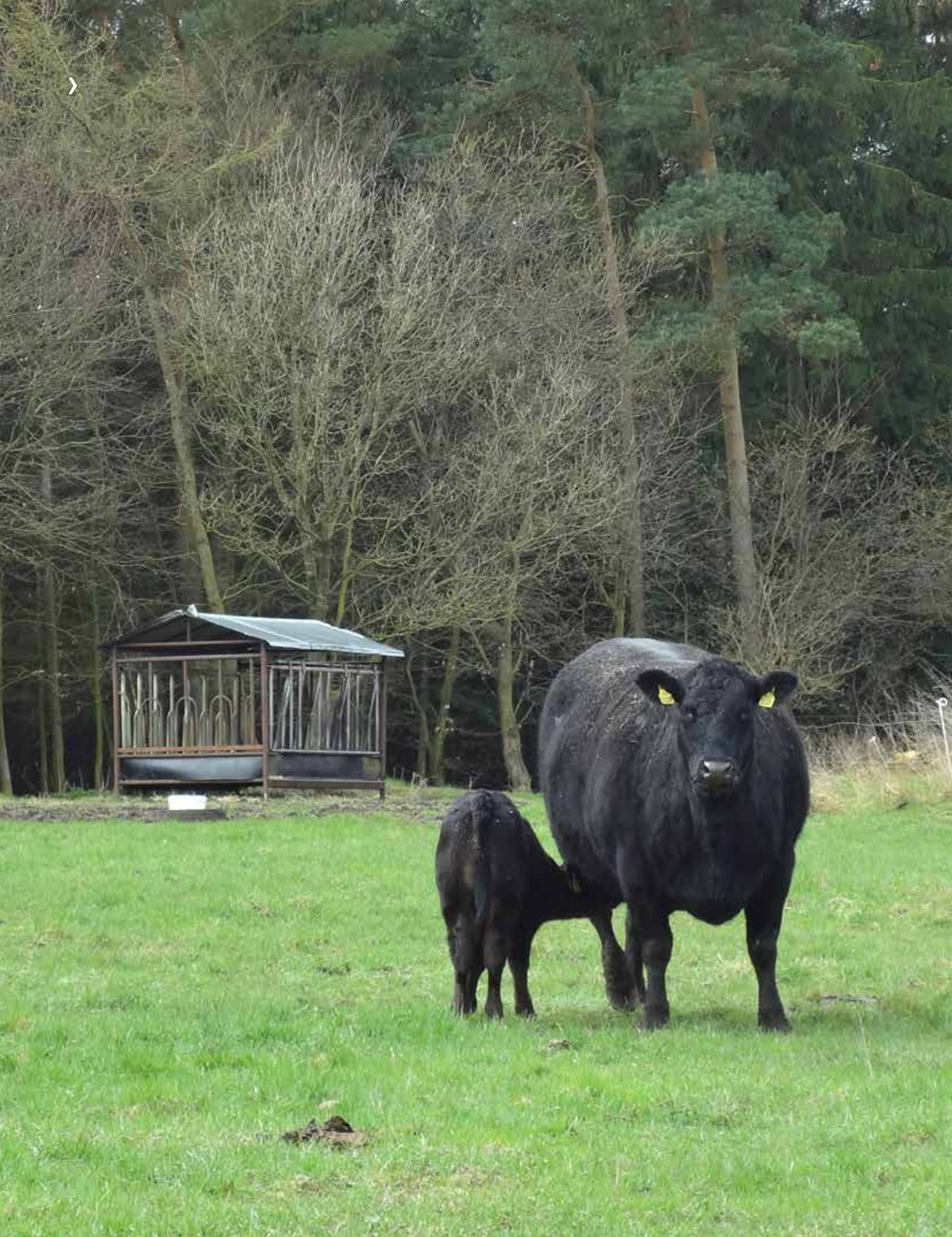
BILLEDE 23: Dyrene, som er opvokset på bedriften, bruger naturen til at finde læ, nyindkøbte dyr bruger oftere hallen.