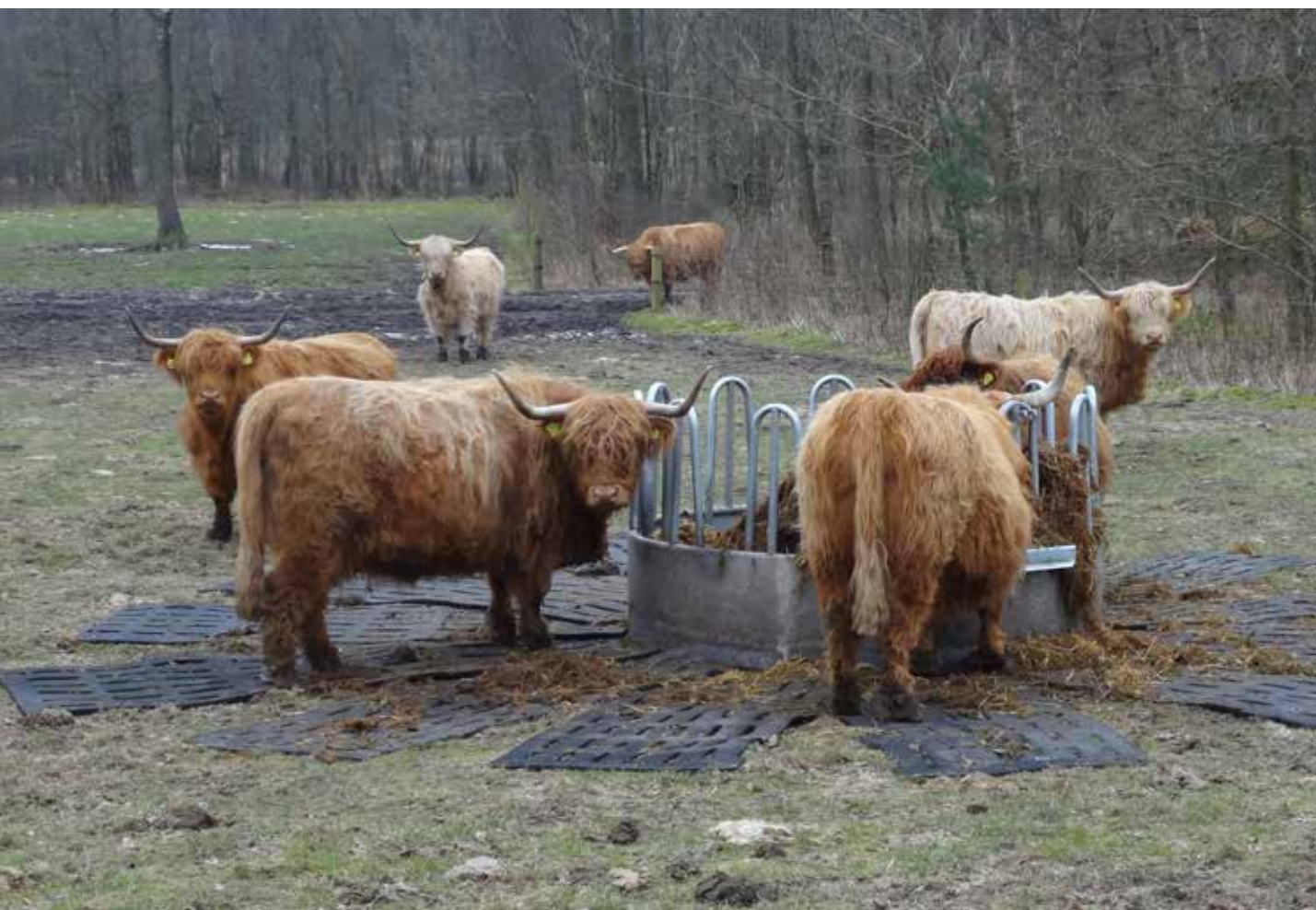
BILLEDE 12: Der er lagt gummimåtter ud rundt om foderhækkene, så der ikke bliver så oprådt om vinteren.

Foderhækkene bliver helst sat på en skråning eller på toppen af en bakke, så vandet kan løbe væk, og det ikke bliver for mudret og vådt omkring dem. Det vides endnu ikke, hvordan håndteringen omkring foderspild bliver ved foderhække-måtterne. Det er desuden planlagt at bruge græsarmeringsplader ved fodringspladsen, så arealet ikke bliver oprådt.