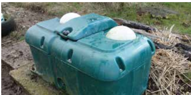
BILLEDE 18: Kar med bolde holder vandet frostfrit