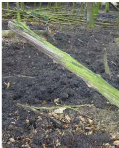
BILLEDE 27 og 28: Dyrene finder hurtigt gode kløpinde inde i skoven.