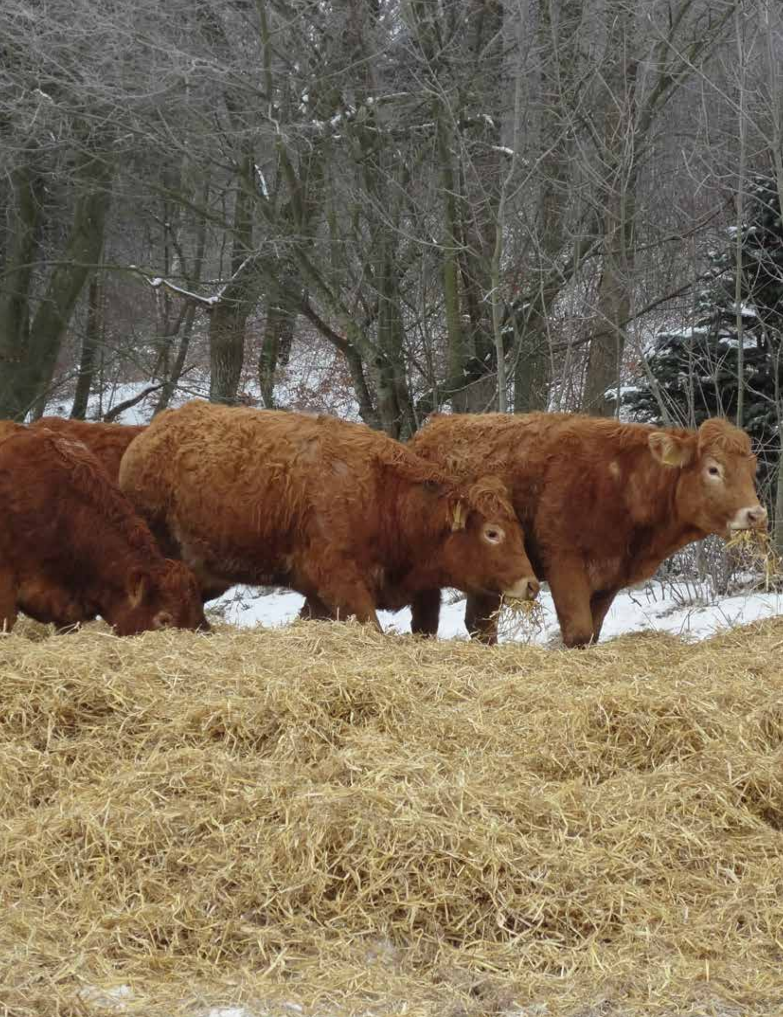
BILLEDE 29: Halmen bliver både brugt til at ligge i og til at æde af.