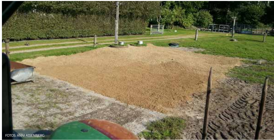
BILLEDE 13 og 14: Etablering af gummimåtter omkring drikkekopper og foderhække.