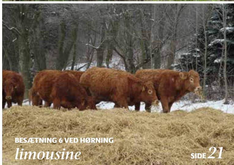
BESÆTNING 6 VED HØRNING