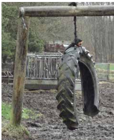
BILLEDE 26: På markerne er der lavet stativer med et overskåret dæk, som dyrene kan klø sig op ad og puffe til.