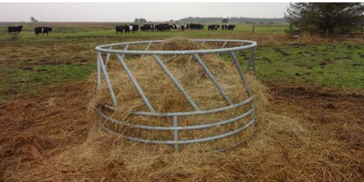
BILLEDE 5: Foderhække flyttes rundt efter behov.