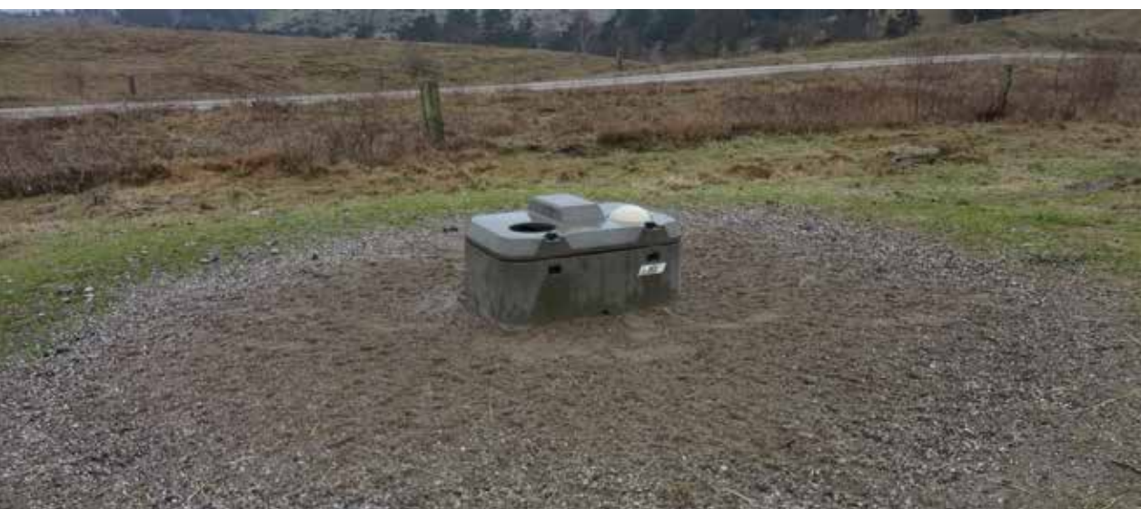
BILLEDE 8: Grus og sand rundt om drikkevandskarrene med bolde.