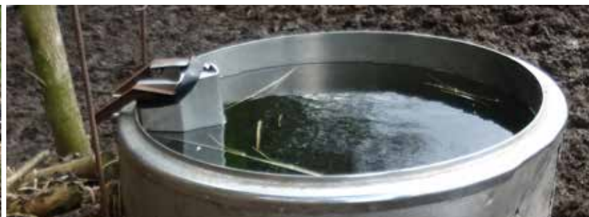
BILLEDE 19: En gammel tank holder vandet frostfrit.