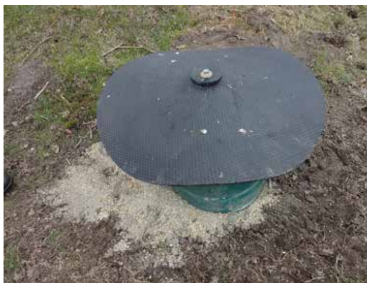
BILLEDE 10 og 11: Dyrene skal puffe et gummilåg op med hovedet for at komme til mineralerne. Dette system virker godt til køerne med horn, som har svært ved at komme til en mineralblanding i en traditionel væltepeter.