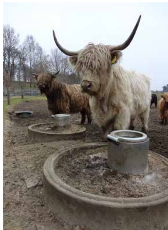
BILLEDE 9: Vintersituation omkring drikkekopperne. Området er tørt, selvom det er trafikeret.

Tyrekalvene har mulighed for at æde valset korn ad libitum i et kalveskul på marken. Mineraler er frit tilgængelige året rundt. Dyrene skal selv puffe et gummilåg op med hovedet for at komme til mineralerne, se billede 10 og 11. Specielt kalvene er hurtige