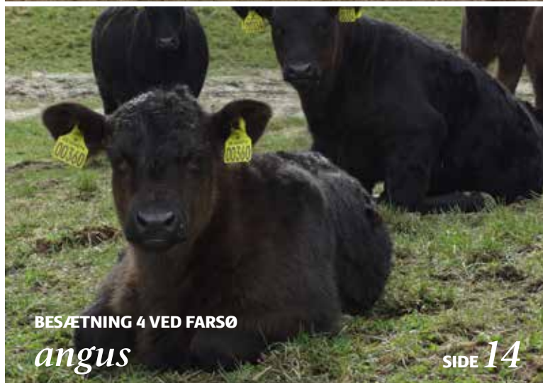
BESÆTNING 4 VED FARSE