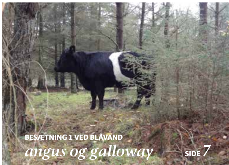
BESÆTNING 1 VED BLÅVAND