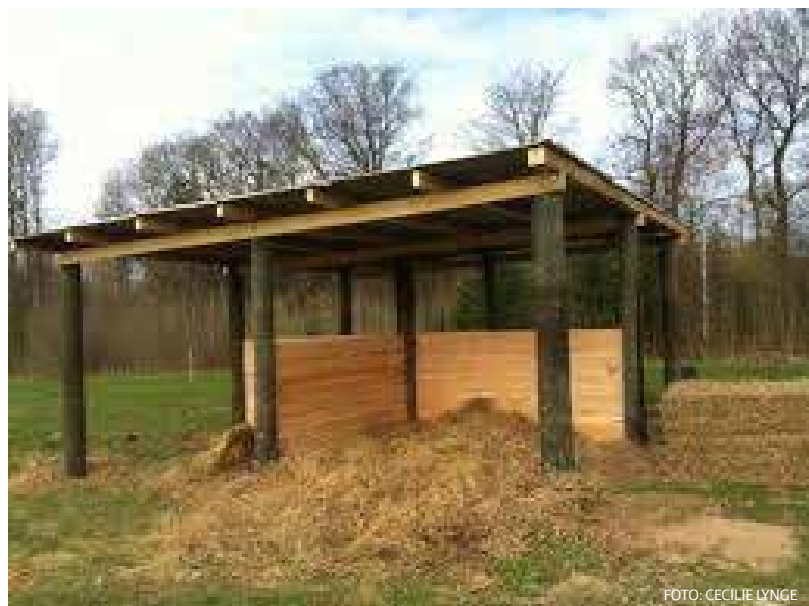
BILLEDE 33: Læskur med vægge opsat som et kryds i midten giver dyrene læ fra alle sider. Læskuret er bygget til heste.

Hvis man bygger skillevægge, der danneret kryds inde i læskuret, kan dyrene finde læ, uanset vindretningen, se billede 33. I dette eksempel er der brugt u-jern til at sætte brædderne i til skillerummene, så højden af væggen kan justeres efter behov, og der er mulighed for at fjerne et eller flere af skillerummene. Fordelen ved denne type læskur er, at det er meget åbent, så dyrene ikke er bange for at gå derind. Ulempen ved denne model er, at læskuret skal være stort i forhold til antallet af dyr, da alle skal kunne finde læ på samme tid.