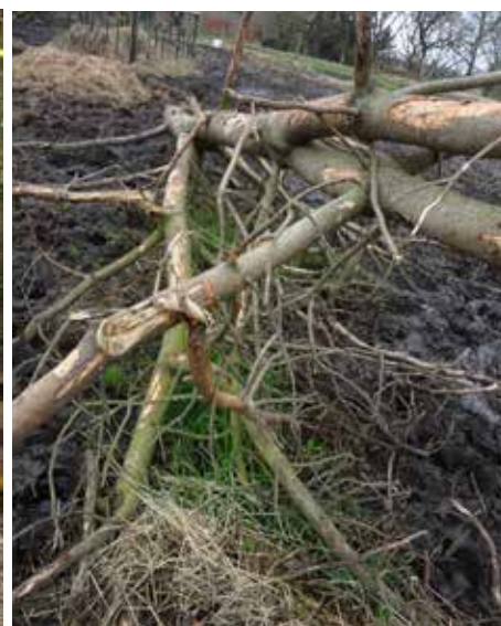
BILLEDE 25: Der køres træer ind til køerne på markerne, så de kan æde af barken på træerne.