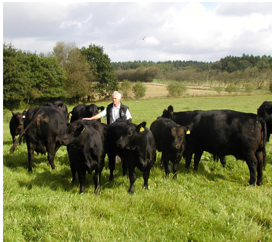
Alle dyr i Angus-racen er homozygotisk pollede (PP)