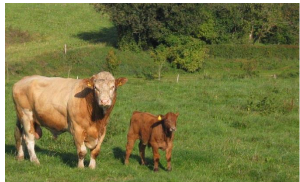
Afpudsning af buskgræs og rodukrudd bør foretages sidst i oktober

Kalium fungerer som en slags kølervæske i planterne, så gennem sæsonen bør der tilføres passende mængder kalium – både af hensyn til ydeevne og overvintring.