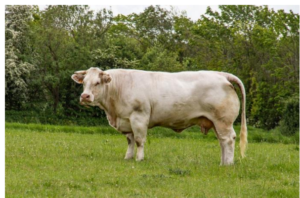
Judee har kort, trekantet hoved, er over middel mht. højde og længde, særdeles muskuløs, gode ben og et lille, veltilhæftet yver.