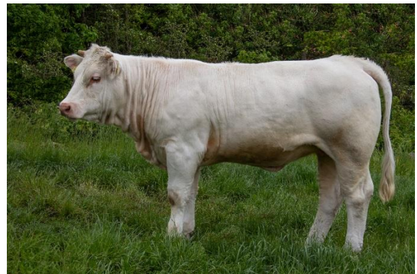
Kviekalven Judee-g fra november 2017 var med i det vindende team. Far er den franske tyr, Major.

Dommerpanelet foretog en første udskilning, hvorefter fem gik videre i konkurrencen, herunder Judee. Efter anden udskilning var der tre tilbage, Judee samt to kvier af henholdsvis Hereford og Simmental.