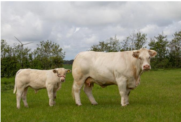
Judee med sin tredje kalv fra januar 2019, tyrekalven Paw-g. Far er den franske tyr, Himalaya. Judee med tyrekalv udstilles på Landsskuet 2019.