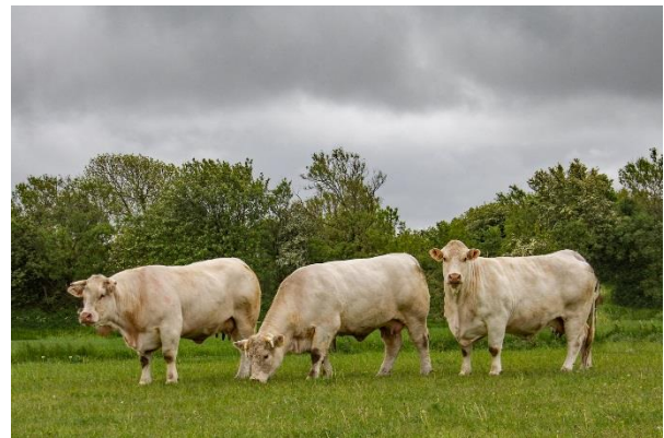
Betydelige Charolais køer hos Charolais-g.